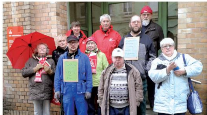
GELA Südbrandenburg: eine Plattform für alle Gewerkschaften

Knapp zwei Jahre nach der Gründung ging GELA unter das Dach des Deutschen Gewerkschaftsbundes (DGB). Wir wollten allen Kolleginnen und Kollegen, egal aus welcher Gewerkschaft, eine Plattform geben. Aus der Hilfe für Erwerbslose wurden mehr und mehr Aktionen. Insbesondere die Agenda 2010 und die damit beförderte Ausweitung prekärer Beschäftigung in Form von Minijobs, Teilzeitbeschäftigung, Leiharbeit und Werkverträgen bot jede Menge Stoff für den politischen Widerstand in Form von Aktionen.