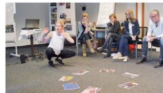
Tolles Angebot: Mehrtägige Seminare machen fit für eine Erstberatung.

Oft sind Betriebsräte die ersten Ansprechpartner für Kolleginnen und Kollegen aus den Betrieben. Die ALI bietet in Zusammenarbeit mit der Bildungsvereinigung Arbeit und Leben mehrtägige Seminare an, um sie fit für eine Erstbe-